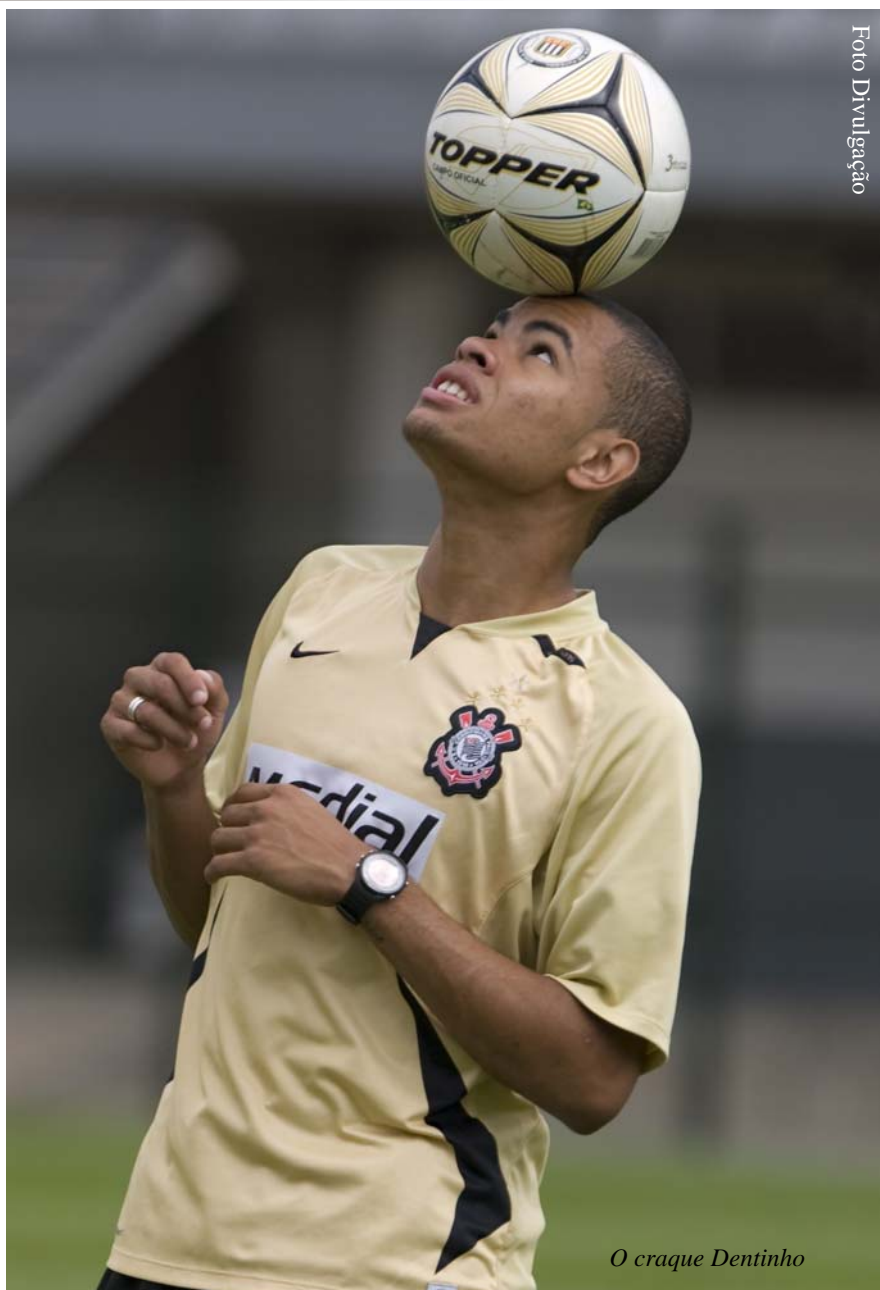
O craque Dentinho

O jovem sempre foi incentivado pelos pais a correr atrás de seu maior sonho - tornar-se esportis-