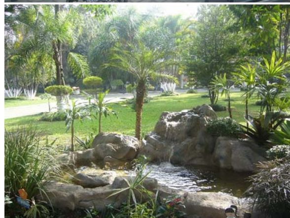
Parlamento. Vista geral do Senadinho